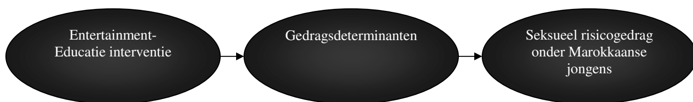
Figuur 2 Conceptueel model

In figuur 2 wordt het conceptueel model van dit onderzoek weergegeven. S.O.A.P. heeft effect op de gedragsdeterminanten en vervolgens op het seksueel risicogedrag onder Marokkaanse jongens. Het onderzoek richt zich op de effecten op: kennis over seksueel risicogedrag, eigen effectiviteit, sociale norm, risico perceptie en het uiteindelijke gedrag. Dit wordt gemeten op een kwantitatief (vragenlijst) en kwalitatief (focusgroep) gemeten.